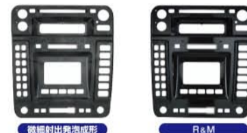
MicroCell® MuCell® R&M RHCM®+MuCell® (センターパネルテスト型による成形サンプルの外観) MuCell®は米TREXEL社の登録商標です。